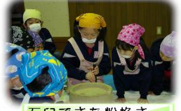
石臼できな粉挽き