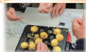
たこ焼き器でカステラ