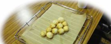
米粉コナツクッキー

実施日： 要予約 (ご希望の日をお知らせください) 所要時間： 約1時間 人数： 1人から 体験料： 作るものや数で料金ご相談 体験場所： 越前市もやいの郷・農楽園 留意事項： 持ち物(エプロン・三角巾)